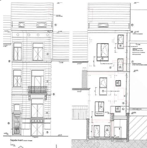
Élévation avant et arrière projetée. Images tirée du dossier