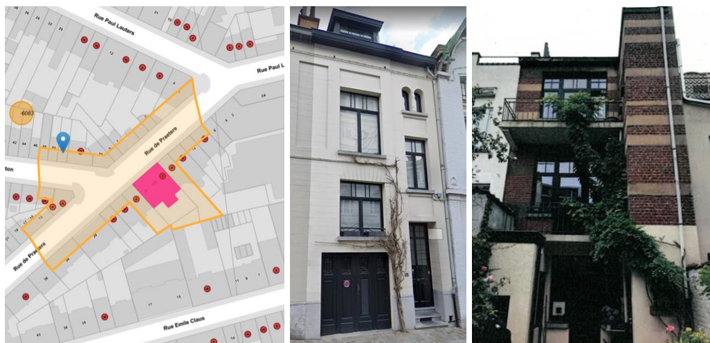
Contexte patrimonial (©Brugis), vues des façades avant et arrière (extr. du dossier de demande)

En réponse à votre courrier du 10/10/2023, reçu le 11/10/2023, nous vous communiquons l'avis émis par la CRMS en sa séance du 18/10/2023, concernant la demande sous rubrique.