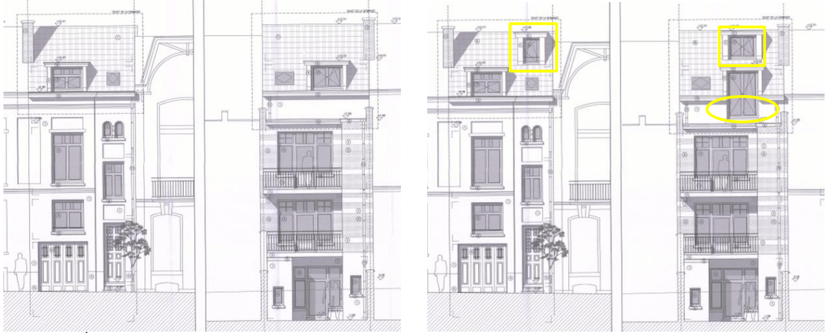
Élévations des façades avant et arrière : situations existante et projetée (extr. du dossier de demande)