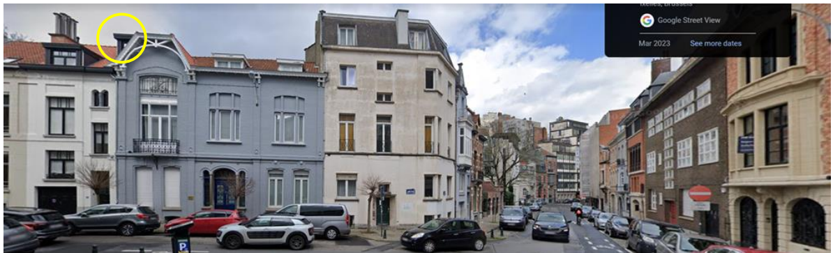
Vue de la maison n°52 et de l'hôtel classé (©Google maps, mars 2023)