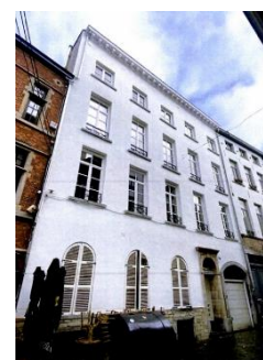
Façade à rue du 11-13 rue Sainte-Anne (figure extraite du dossier de demande)