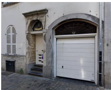
Porte de garage dans l'ancienne entrée cochère.

La Commission se réjouit des affectations proposées par le programme, qui contribuent à améliorer la mixité dans le quartier du Grand Sablon en remplaçant des locaux inoccupés de la boulangerie-pâtisserie par des logements à rue aux étages supérieurs du n°12 place du Grand Sablon. Elle considère également que le retour à la division parcellaire ancienne pour le rez-de-chaussée commercial est très positif, et contribue à améliorer la lisibilité des bâtiments concernés.