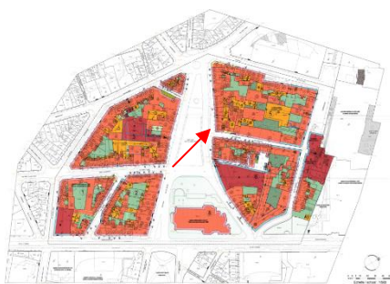
Extrait du PPAS Grand Sablon.