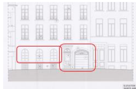
Situation projetée au 11-13 rue Sainte-Anne (image extraite du dossier de demande ; annotée par le secrétariat de la CRMS).

Concernant le projet architectural, la CRMS soutient le remplacement des châssis à croisillons du 11-13 rue Sainte-Anne par des modèles à grands carreaux, plus adaptés à la typologie néoclassique de la façade. Elle regrette néanmoins que le projet ne prévoit pas de remplacer la porte de garage sectionnelle, particulièrement dévalorisante dans l'environnement bâti très qualitatif de la rue Sainte-Anne. Elle demande de restituer une porte adaptée à l'entrée cochère, afin de rétablir la situation de droit. Elle recommande également de remplacer le parement prévu en « crépi/cimentage » par un enduit lisse, plus conforme à l'architecture classique, et d'uniformiser les garde-corps du soubassement.