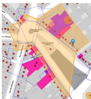
Situation patrimoniale

En réponse à votre courrier du 08/11/2023, nous vous communiquons l'avis émis par la CRMS en sa séance du 29/11/2023, concernant la demande sous rubrique.