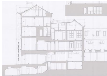
Situation existante côté Grand Sablon (coupe extraite du dossier de demande)