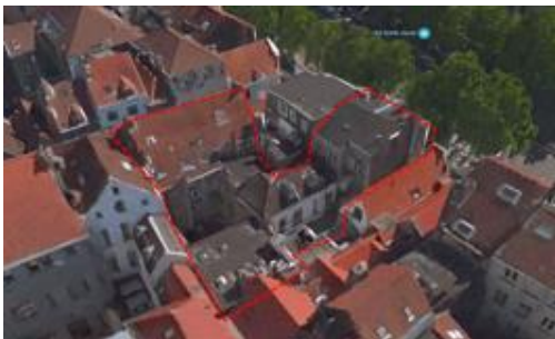
Vue aérienne de l'intérieur d'îlot

La demande consiste à transformer les immeubles sis place du Grand Sablon n°s 12 et 13 afin d'y aménager trois commerces, rénover trois appartements existants et aménager trois duplex deux chambres. Une nouvelle circulation commune desservant les appartements est créée dans une annexe en intérieur d'îlot datant du XX e siècle ; les cours existantes en intérieur d'îlot sont réaménagées et végétalisées. Le rez-de-chaussée commercial côté Grand Sablon est redivisé en deux commerces distincts, permettant de retrouver la division parcellaire d'origine.