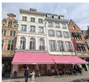
Façades à rue du 12-13 place du Grand Sablon