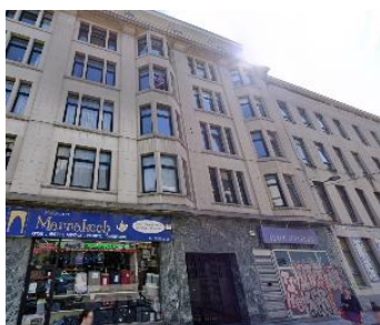
Bestaande situatie