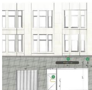
Project. Document uit het aanvraagdossier