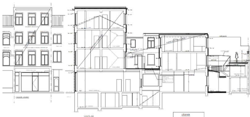
Situation projetée (image extraite du dossier de demande)

La demande consiste à transformer la cour du rez-de-chaussée d'une maison de rapport néoclassique pour y aménager un petit jardin et une terrasse, à transformer la vitrine du commerce à front de rue, en état vétuste, et à isoler par l'extérieur les façades et toitures plates à l'exception de la façade avant.