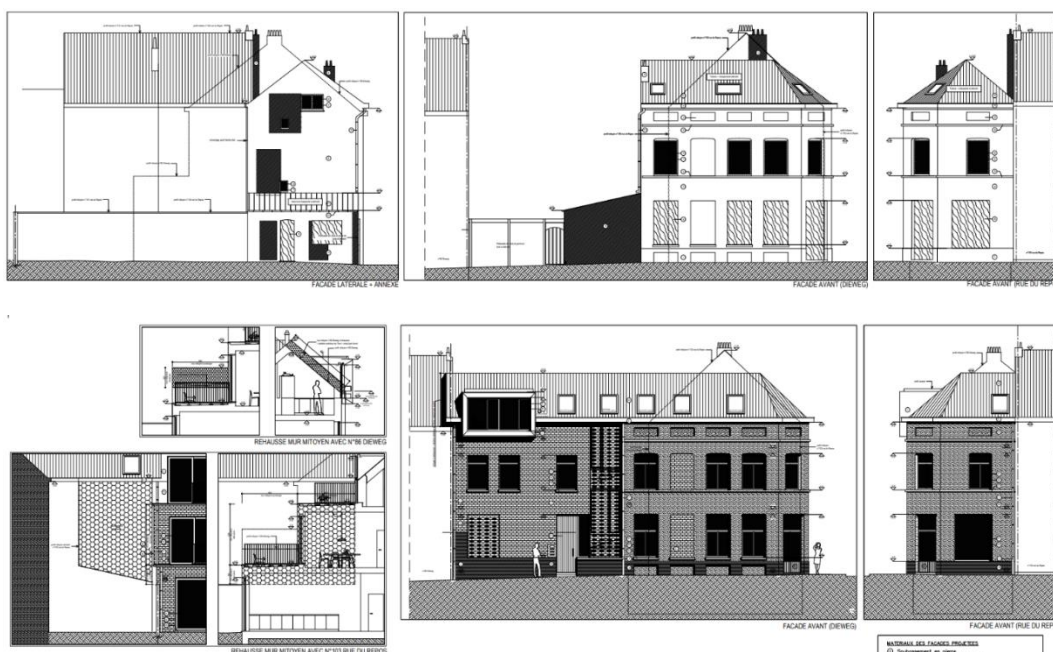
Situation existante et situation projetée.

Le nouveau volume s'inscrit dans le prolongement du bâtiment d'angle néoclassique, dont il reprend les gabarits (ligne de corniche et toiture). Les murs sont couverts d'un parement de briques de terre cuite de teinte gris clair, ajouré au droit de la cage d'escalier et du local vélo. Une grande lucarne en zinc est prévue en toiture, dont l'expression architecturale fait, selon le demandeur, référence au bow-window de la maison voisine au Dieweg, n°86.