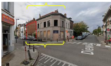
Bâtiment d'angle néoclassique et gabarit de la nouvelle construction (en rouge).