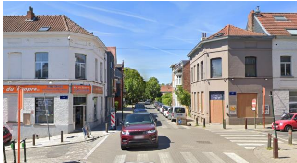
Les deux maisons néoclassiques forment une composition d'entrée de rue caractéristique de l'urbanisme néoclassique, que la Commission propose de revaloriser. (© Google Streetview).

Elle se réjouit de la réaffectation prévue de la maison d'angle actuellement inoccupée, mais demande d'affiner le projet de rénovation dans le sens d'un plus grand respect de la typologie néoclassique du bien et en veillant à sa cohérence avec le bâtiment d'angle voisin. La Commission demande de réaliser les nouveaux châssis en bois de couleur claire (et non en aluminium) et préconise le recours à une teinte plus claire pour l'enduit. Elle recommande d'homogénéiser la couleur de la façade avec le bâtiment d'angle voisin, afin de valoriser le dispositif d'entrée de rue néoclassique et d'en souligner la symétrie. La légère rehausse de la toiture, l'adaptation du raccord avec le bâtiment voisin rue du Repos et les transformations intérieures n'appellent pas de remarques particulières.