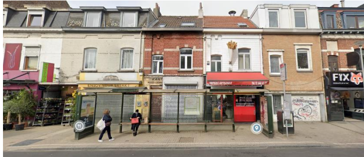
Devantures hétérogènes faisant face au cimetière d'Ixelles

sur les briques d'origine et d'un enduit blanc cassé autour de la vitrine, caisson à volet apparent, ...). Elle demande de la revoir dans un meilleur respect de la zone de protection du cimetière et du bien lui-même, et de requalifier l'entrée des logements, comme cela est par ailleurs prévu par la situation de droit.