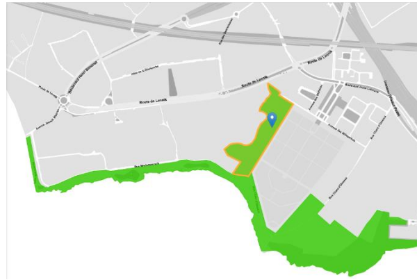
Site: Vallon Meylemeersch (classement 21/12/2017) https://doc.patrimoine.brussels/REGISTRE/AG/049_082.pdf