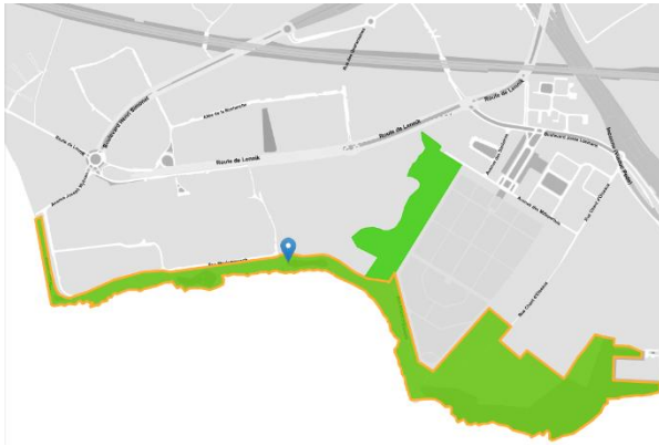
Site Vogelzang (classement 19/3/2009) https://doc.patrimoine.brussels/REGISTRE/AG/044_013.pdf