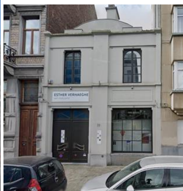
Contexte patrimonial – Vue du n°33 (extr. du dossier de demande)

Le bien concerné par la demande se situe dans la zone de protection de la maison personnelle (avec atelier) du sculpteur A. Crick, classée comme monument et située au n°64 de la rue Simonis. Il est en outre entouré de deux biens inscrits à l'Inventaire du patrimoine architectural de la Région de Bruxelles-Capitale.