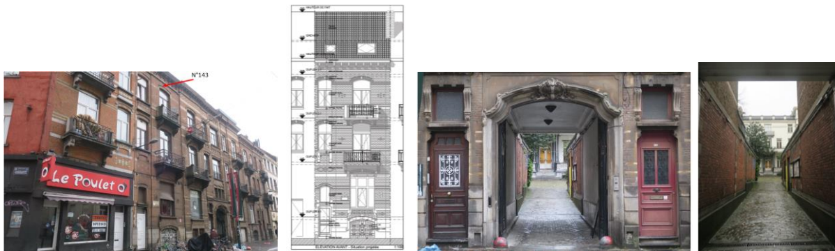
A gauche et au centre, façade avant actuelle et projetée (extrait du dossier). Au centre et à droite, portes devant servir de modèle à la restitution et passage d'entrée de la Maison des Arts (photos CRMS, 2024)