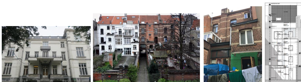
A droite, vue de la façade principale de la Maison des Arts depuis l'arrière des maisons à rue (photo CRMS, 2024). Au centre gauche, vue des façades arrière des maisons à rue depuis la Maison des Arts (© Urban.brussels). A droite, la façade arrière actuelle et projetée (extraits du dossier)