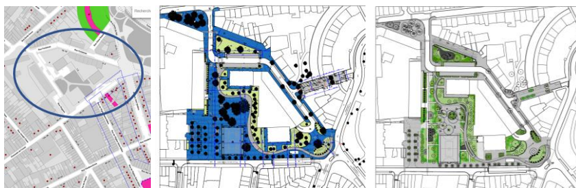
Extrait Brugis et plans de l'existant et de réalisation des plantations (extraits du dossier)

En réponse à votre courrier du 04/01/2024, nous vous communiquons l'avis émis par la CRMS en sa séance du 10/01/2024, concernant la demande sous rubrique.