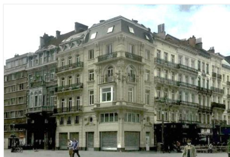
Localisation du projet et état existant des façades (photo jointe à la demande)