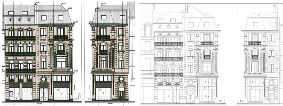
Élévations des façades projetées : à gauche, projet de 2022 et à droite, proposition actuelle (documents issus des demandes respectives)

Depuis, le projet a été adapté suite aux remarques formulées par les différents intervenants. Il propose maintenant de créer une double hauteur dans l'espace d'angle du bâtiment. Au niveau des devantures, il prévoit :