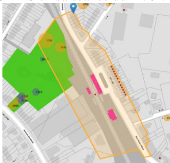
Contexte patrimonial

En réponse à votre courrier du 05/02/2024, reçu le 12/02/2024, nous vous communiquons l'avis émis par la CRMS en sa séance du 21/02/2024, concernant la demande sous rubrique.