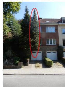
Façade du bâtiment et parti cyprès à abattre. (Document extrait du dossier de demande)