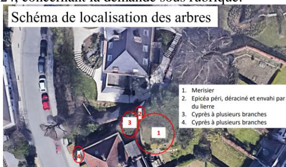
Schéma de localisation des arbres (Document extrait du dossier de demande)