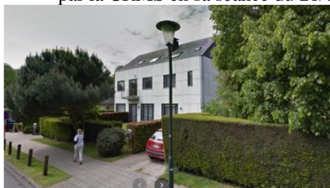
Situation avant démolition

En réponse à votre courrier du 09/02/2024, reçu le 13/02/2024, nous vous communiquons l'avis émis par la CRMS en sa séance du 21/02/2024, concernant la demande sous rubrique.