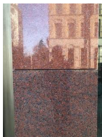
Éléments de parement d'origine et remplacés