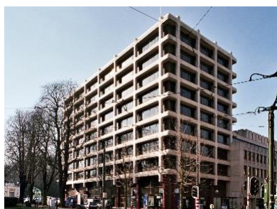
Vue extérieure du 521-525 avenue Louise (Inventaire du Patrimoine architectural)