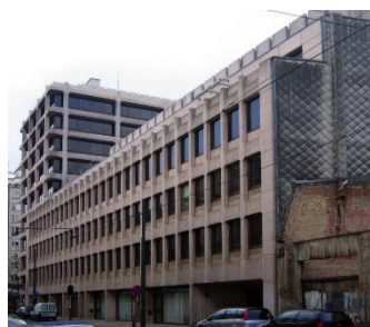
Vue extérieure du 2-18 avenue Legrand (Inventaire du Patrimoine architectural)