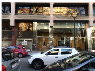
Entrée avenue Louise, état actuel

La CRMS accepte le principe du réaménagement intérieur du rez-de-chaussée. L'aménagement actuel remonte à une campagne de rénovation menée en 2003, et ne présente pas d'intérêt artistique ou architectural particulier. Les châssis de l'entrée étant issus de la même transformation, leur remplacement ne pose pas de souci d'un point de vue patrimonial. Le projet actuel ne fait toutefois pas état du matériau ni de la couleur des nouveaux châssis. En tout état de cause, il s'agit d'opter pour des châssis de teinte bronze, identiques à ceux d'origine encore partiellement présents en façade.