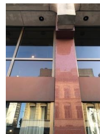
Colonnes en marbre rouge et bandeau à supprimer (Photographie CRMS)