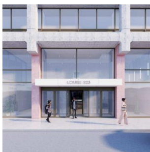
Nouvelle entrée projetée (Document extrait du dossier)