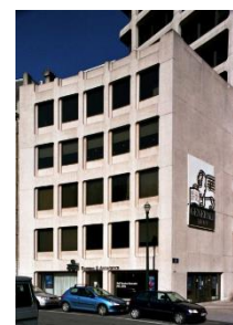
Immeuble face au Bois de la Cambre