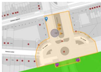
Contexte patrimonial

En réponse à votre courrier du 20/02/2024, reçu le 20/02/2024, nous vous communiquons l'avis émis par la CRMS en sa séance du 13/03/2024, concernant la demande sous rubrique.