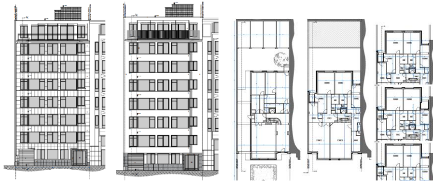
Situation existante et projetée de la façade avant. Situation projetée du rez-de-chaussée et des étages (extraits du dossier)