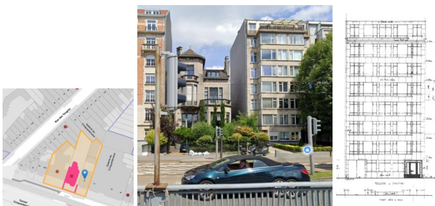
De gauche à droite, extrait Brugis, vue actuelle depuis l'avenue de Tervueren (© Google maps) et élévation de la façade avant (archive extraite du dossier)

En réponse à votre courrier du 22/02/2024, reçu le 23/02/2024, nous vous communiquons l'avis émis par la CRMS en sa séance du 13/03/2024, concernant la demande sous rubrique.