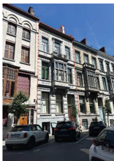
Voor- en de achtergevel, foto's uit het aanvraagdossier