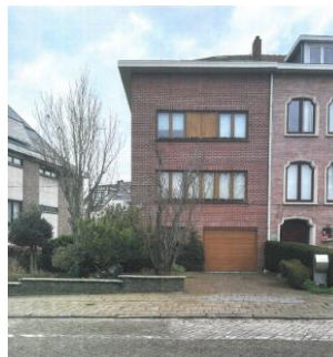
Extr. du dossier de demande