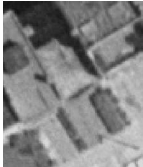
Vue aérienne de 1971.

Dans son avis du 19/01/2022, la CRMS demandait que le jardin soit également étudié. Il ressort de la phase d'enquête qu'il ne présente pas d'intérêt patrimonial majeur. Aucun document d'archives n'a par ailleurs pu être retrouvé pour le documenter. La CRMS souscrit à ce qu'il ne soit pas repris dans l'emprise.