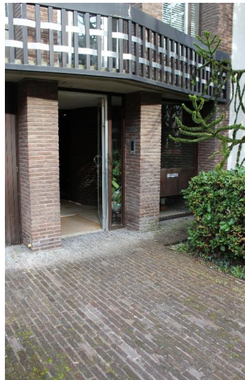
Détail de la zone de recul .