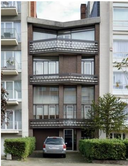
Elévation de la façade à rue.

Par ailleurs, la CRMS regrette que la zone de recul ne soit pas reprise dans l'étendue de protection. Celle-ci s'articule particulièrement bien avec la maison et présente un calepinage en briques en parfaite harmonie avec celles de la façade. L'aménagement de la zone, déjà en place en 1971 (voir vue aérienne) pourrait très probablement être celui d'origine. La CRMS demande, au minimum, que l'intérêt de la zone de recul puisse être documenté et reconnu dans l'annexe jointe à l'arrêté et que son emprise soit comprise dans le périmètre de la zone de protection.