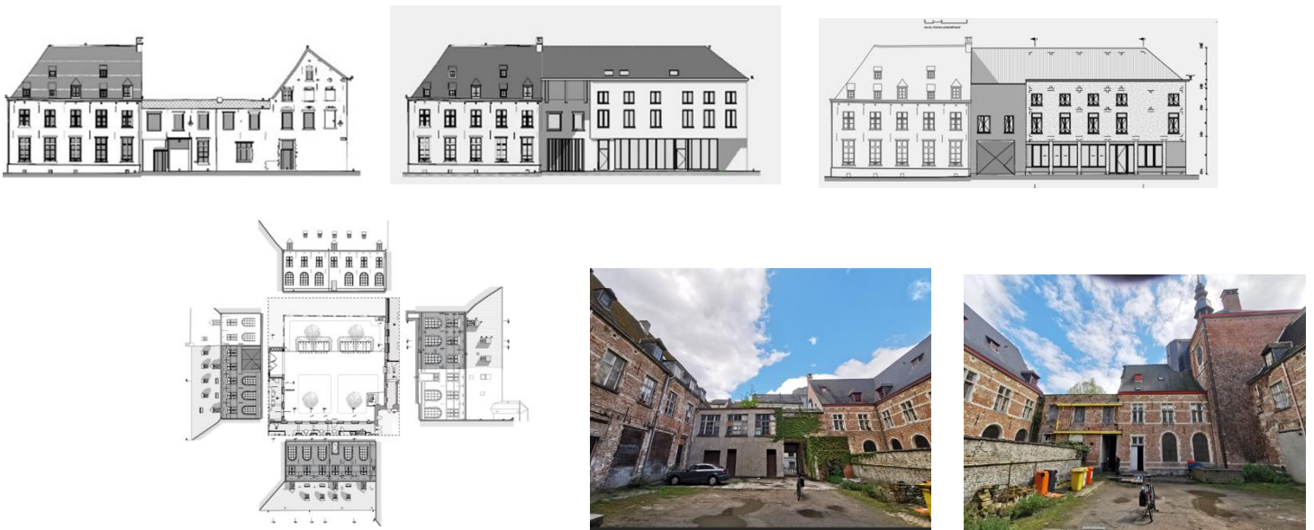
Grafische documenten uit het voorbereidend document van de projectvergadering ; foto's KCML (april 2024)

Tijdens de projectvergadering werd ook de herwaardering van de kloostertuin en de restauratie met herstel van de coherentie van de gevels en daken van de pandgang toegelicht. Daarnaast is het belang van het nieuwe volume benadrukt om het nieuwe sociale programma (maaltijdbedeling aan en opvang van vluchtelingen) te kunnen realiseren.